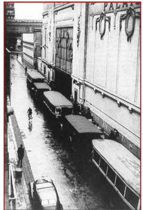
Les cars de la "section spéciale" garés le long du Vélodrome d'Hiver.

Au total 12 884 personnes ont été arrêtées, soit 46% des juifs étrangers et apatrides qui devaient être internés. Parmi eux 3031 hommes, 5802 femmes, 4051 enfants.