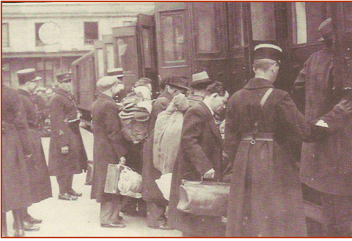
À la gare d'Orléans-Austerlitz, les Juifs montent dans les trains dirigés sur les camps du Loiret.