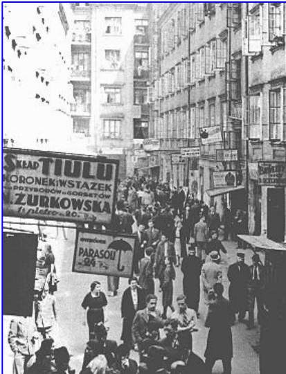
Cour commerciale de la rue Nalewki, Varsovie, 1938.